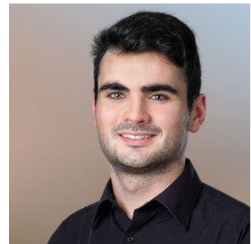
Das Interview führte: Désirée Fessler

Das ganze Prozedere, also wie die die Debatte abläuft und wer in welcher Reihenfolge spricht. Am Anfang hatte ich extrem Respekt vor diesem Amt – ich dachte, alle Stadträt:innen seien mir haushoch überlegen. Bis zu einem gewissen Grad stimmt das, weil sie über mehr Erfahrung und Wissen verfügen, ich hatte aber trotzdem das Gefühl, dass ich den Debatten gut folgen konnte.